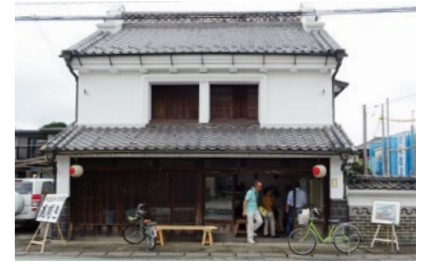
蔵開き当日の長谷川見世蔵

7月29日、登録有形文化財になったことを記念して講演会を地域のNPO法人伝統文化推進機構、NPO法人岩槻市民まちづくり協議会と共催で開催した。