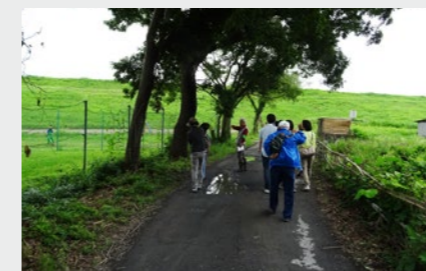
定例の自然観察会で季節を楽しむ

また、地域の小中学校、自治会連合会、埼玉大学等と連携しながら、防災や交通環境の改善等、地域のまちづくりへの取り組みに取り組んでいます。