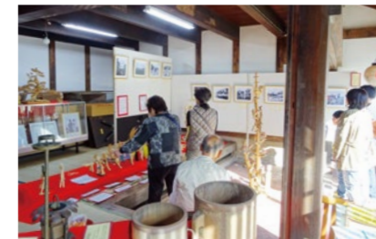
蔵開きには懐かしい写真などを掲示しています