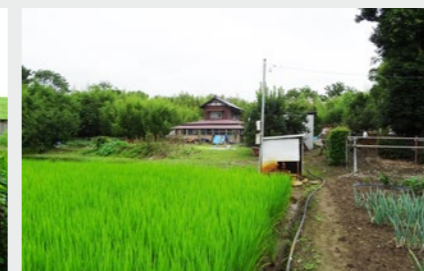
堤外にある旧農家が活動拠点