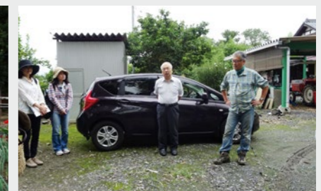
尾田会長のご挨拶で定例の観察会が始まる