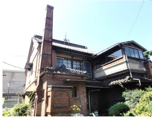
旧大政商店本庄支店・柴崎家 1920