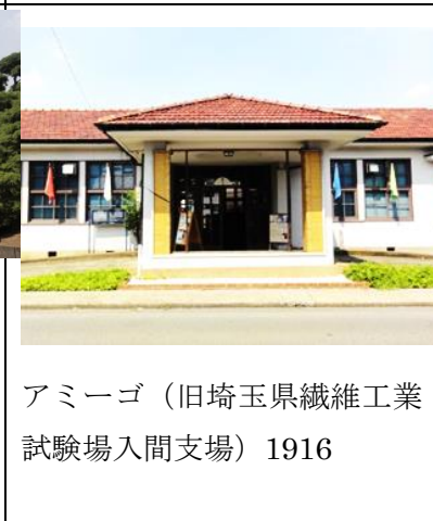
アミーゴ（旧埼玉県繊維工業試験場入間支場） 1916