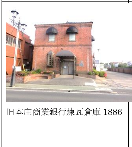
旧本庄商業銀行煉瓦倉庫 1886