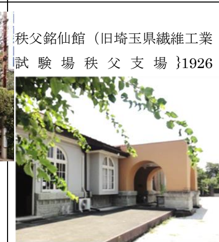
秩父銘仙館（旧埼玉県繊維工業試験場秩父支場）1926