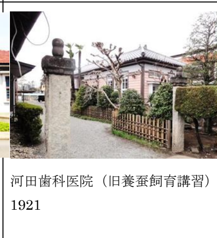
河田歯科医院（旧養蚕飼育講習） 1921