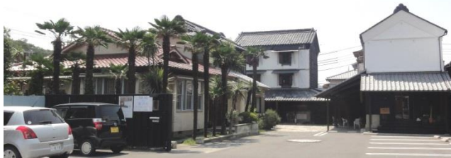
行田市・旧奥貫邸。現在、閑居、朽木氏事務所、パン屋、ギャラリー