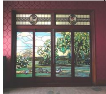
鍋平邸別邸の離れ (1939)