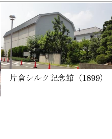
片倉シルク記念館（1899）